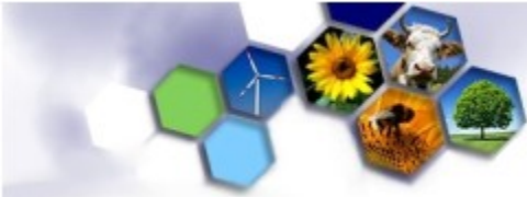
Table of content